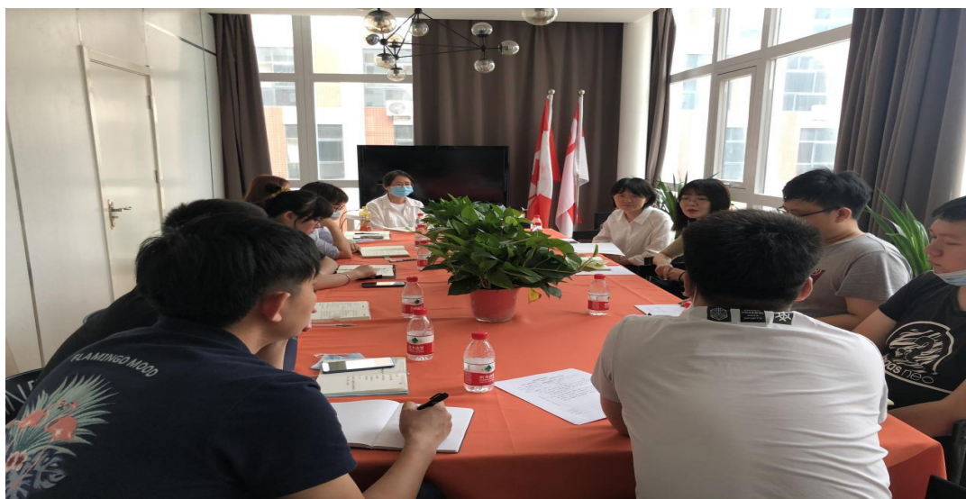
国际交流处审核评估工作任务推进会会场

进行再动员，并作出三点要求：一是思想上要高度重视。严格按照学校评估中心通知要求，认真落实各项工作；二要保质保量地开展各项相关数据的整理与汇总，务必要全面准确；三是要主动查找差距和不足，做到以评促建、以评促改、以评促管、评建结合、重在建设，进一步推进学校外事工作的发展。随后，就审核评估工作的主要任务进行了布置和分工。