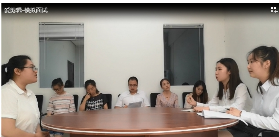
人力资源管理专业学生现场模拟人力资源招聘

此外，管理学院近年来还大力推进课程考核方式改革，构建“APP 过程考核+实践应用+多维评价”的课程考核评价体系，注重考查学生的实践动手能力和专业综合技能。全院有将近 20 门课进行考试方式改革。比如酒店管