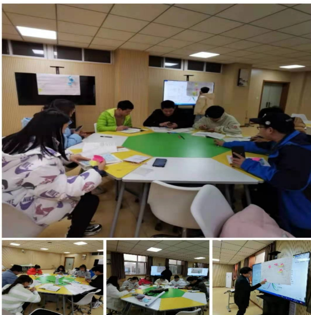
学生进行分组讨论学习

有讲解的问题，而是由学生用提问的形式解决每一个学生存在的个性问题，促进了每一个学生对知识的理解。翻转课堂利用丰富的信息化资源，让学生逐渐成为学习的主角。学生不仅在翻转课堂上更有效地学到了知识，而且在潜移默化中提高了自身的学习能力。