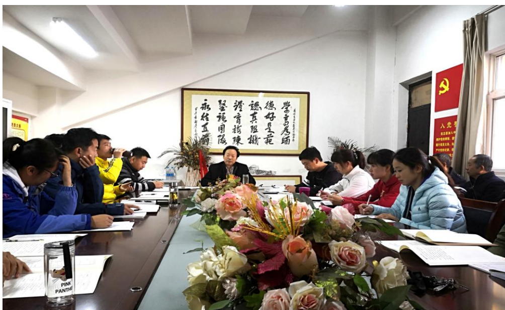
体育部召开本科教学审核评估第一次会议

2018年11月21日，体育部全体教师在会议室召开本科教学审核评估工作动员会议。