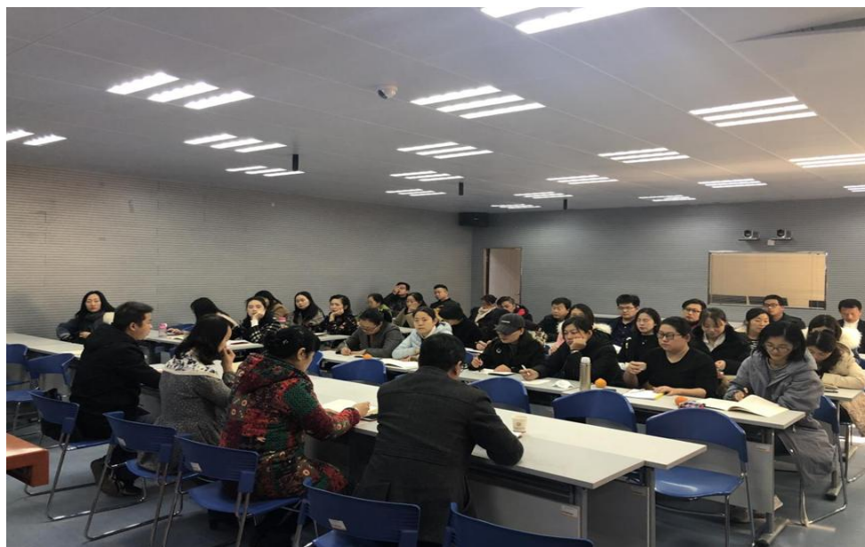
时装艺术学院召开本科教学审核评估第一次会议

估,在国内高校竞争如此激烈的环境中,通过审核评估能够得到学生、家长以及社会的支持和认可。