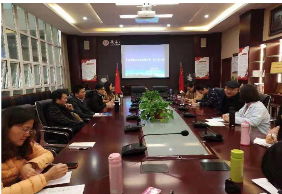
珠宝学院召开本科教学审核评估第一次会议

项工作，凝练特色，打造亮点。他强调，在审核评估时期，大家要依据审核评估要求，有目标、有重点地推进评估工作，努力把各项工作任务做实、做精、做细，把握评估的有利契机，实现以评促建的目标，推进我院人才培养质量迈上新台阶。