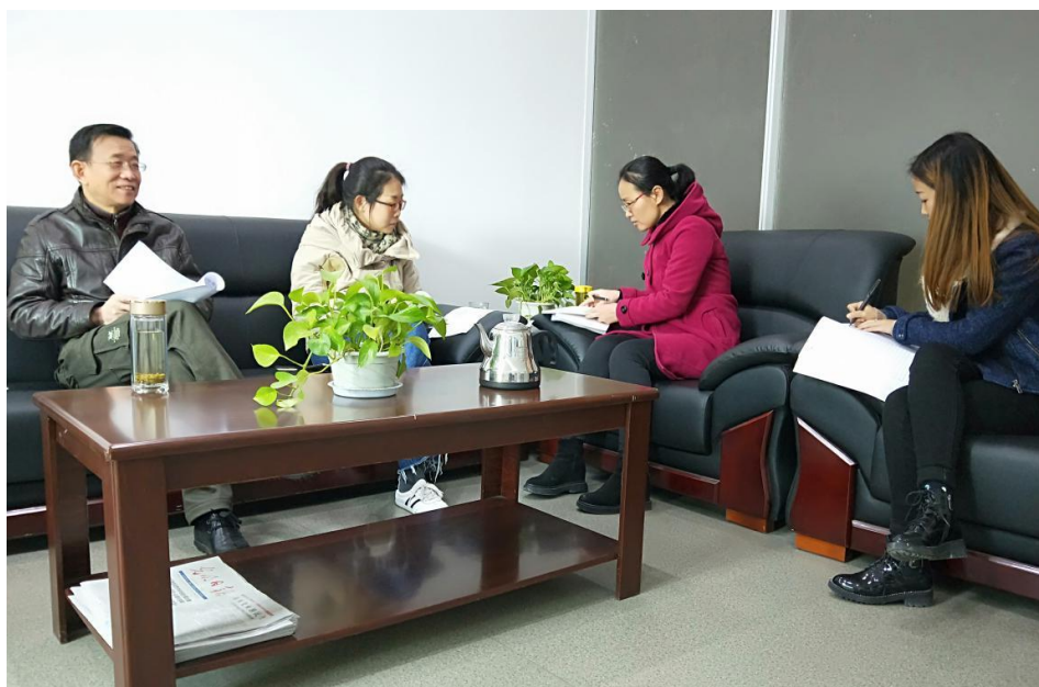
创新创业学院召开本科教学审核评估第一次会议