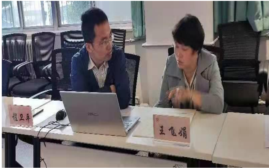
检查1组检查创新创业学院审核评估资料