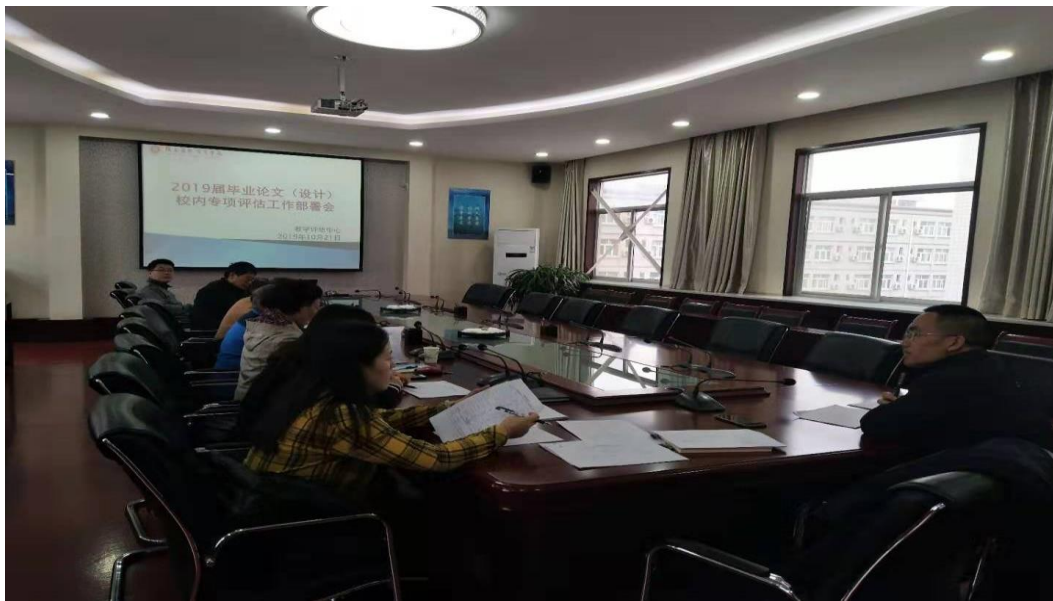
2019届毕业论文（设计）专项评估会议现场部署会

校内毕业论文（设计）评估完成后，评估组将形成书面反馈意见，反馈给相关教学单位，各单位将按照反馈意见对毕业论文工作进行相应的整改，制定切实可行的整改措施，对存在问题加以纠正，并在以后的毕业论文（设计）工作中严格按规范要求操作，为保障和提高学校人才培养质量起到积极的促进作用。