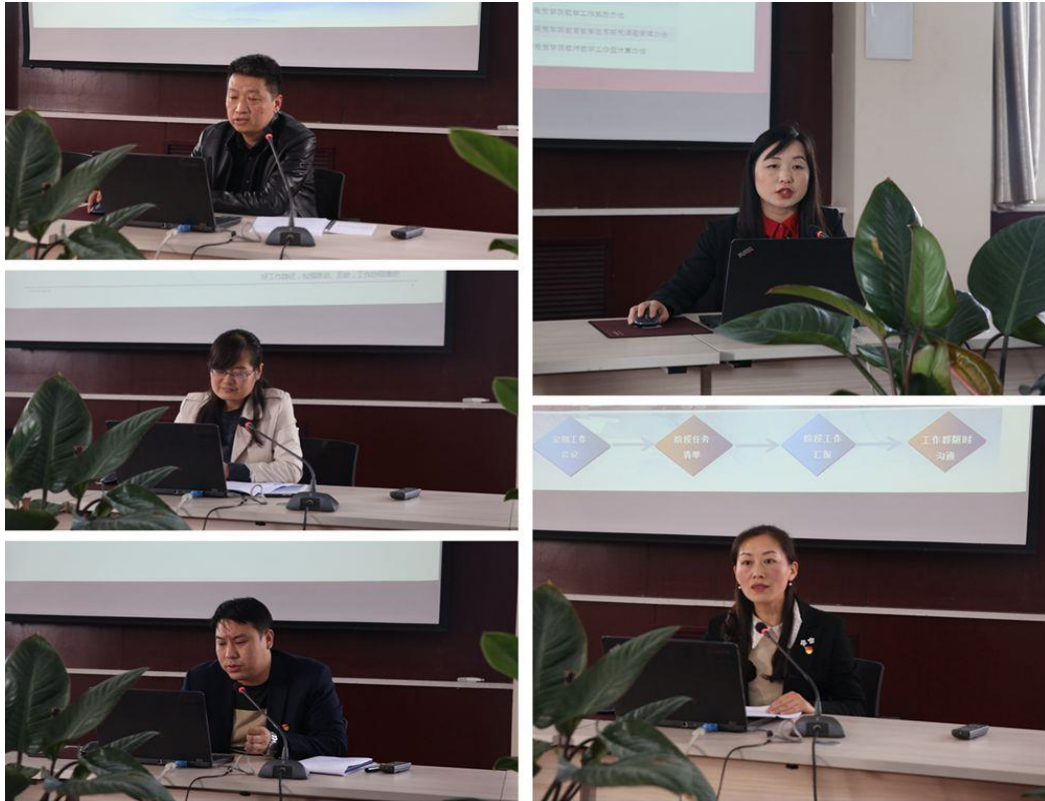
各专项工作组汇报本组工作开展情况