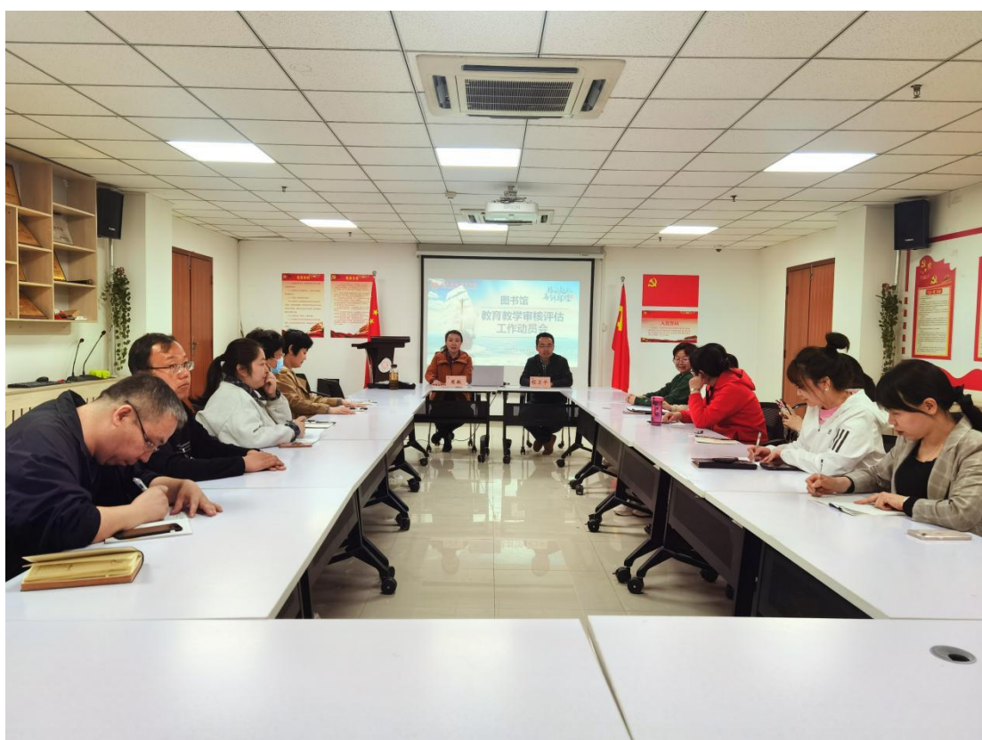
会议现场交流互动