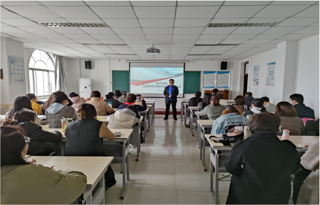
赵旭领学审核评估工作指南